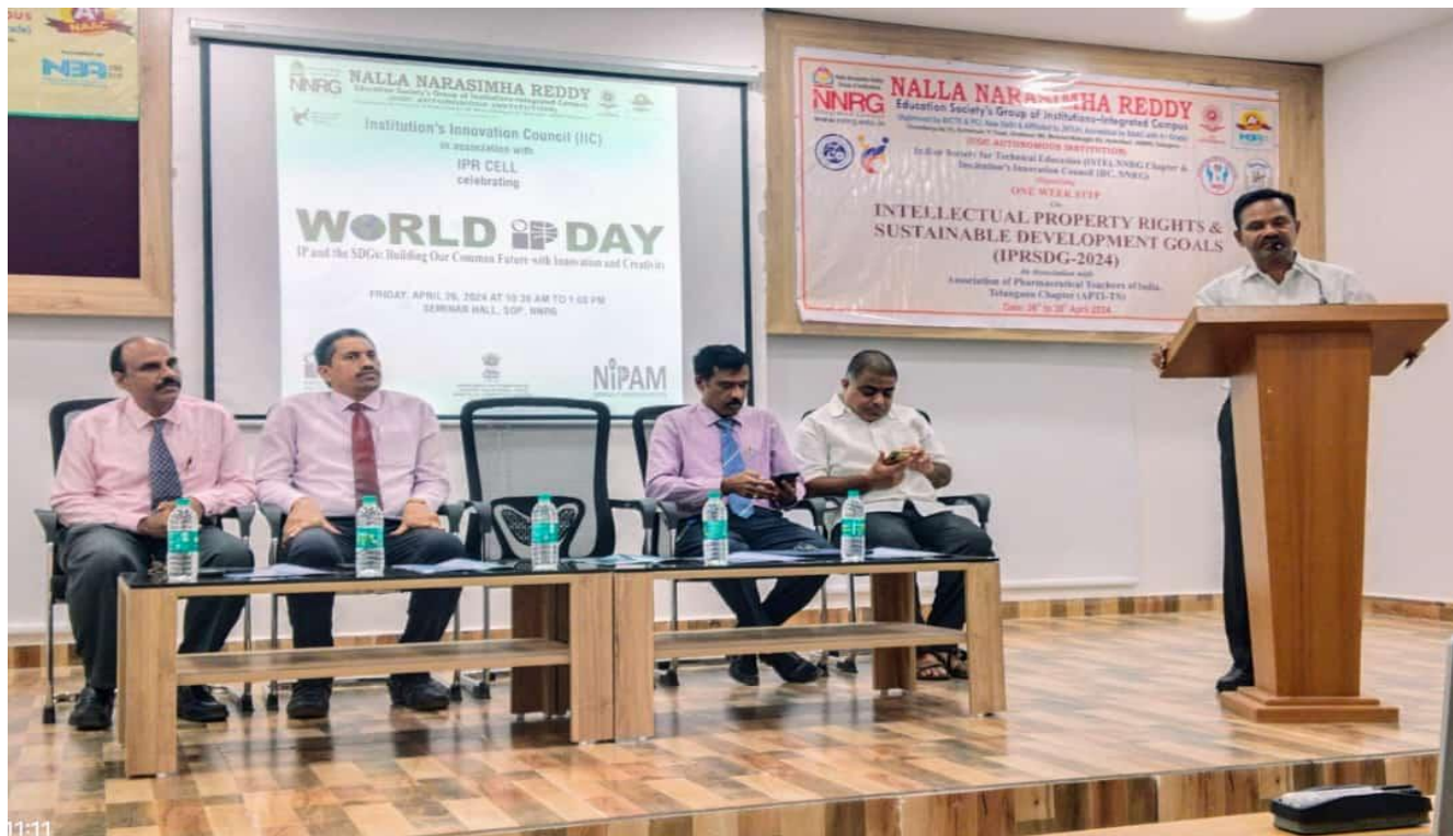
Glimpses of Inaugural session of FDP on IPR & SDG