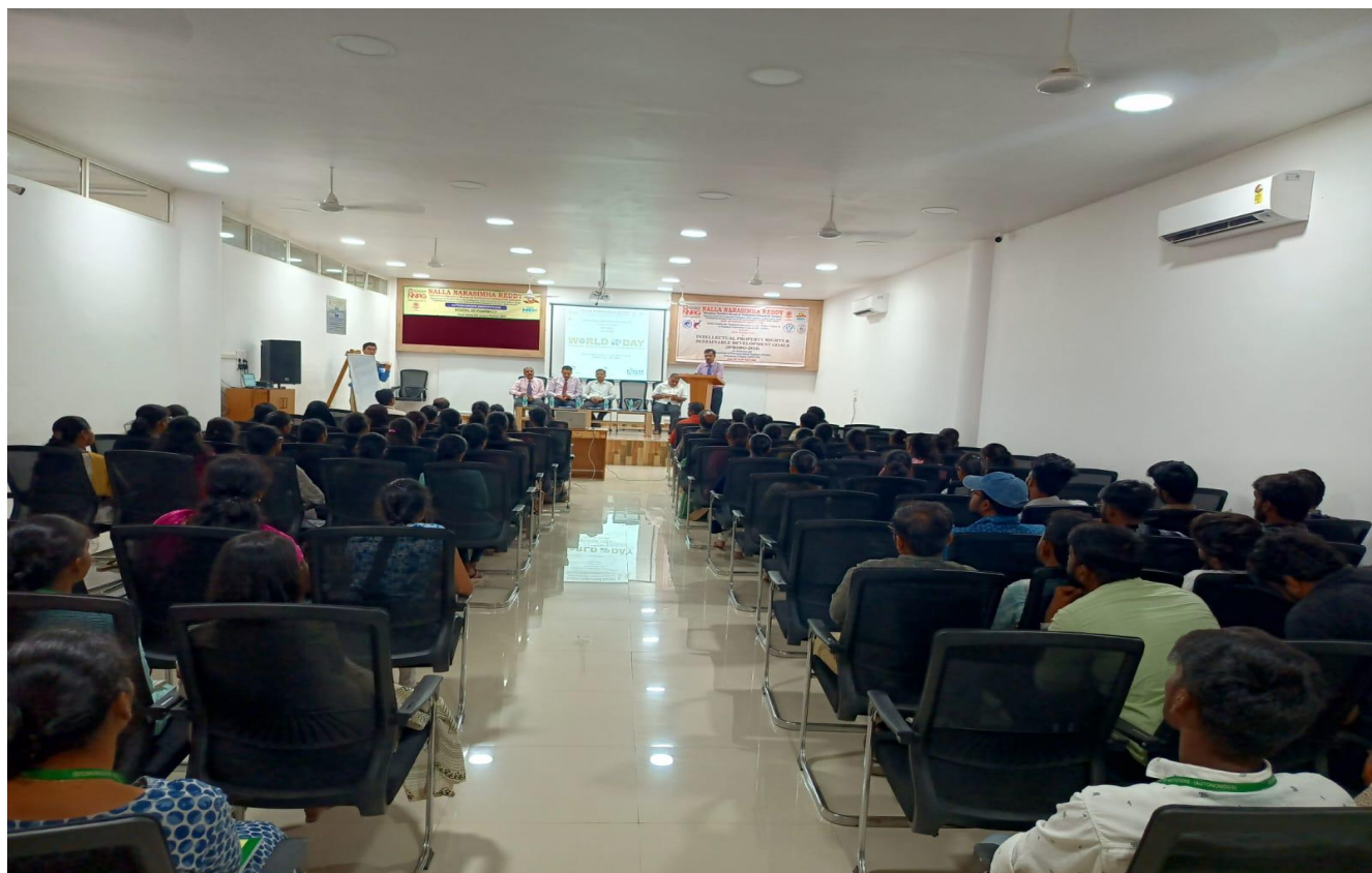
Glimpses of Inaugural session of FDP on IPR & SDG