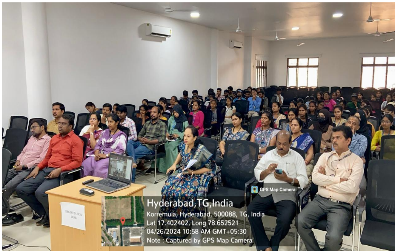
Participants at the Inaugural Session