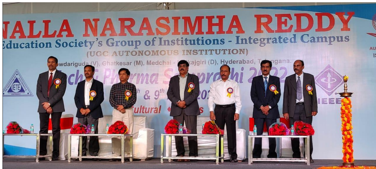
Inaugural of Pharmasamprathi 2022