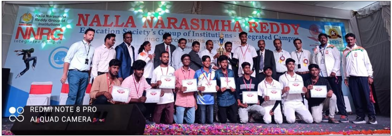
Men's Cricket Winners B.Pharmacy I year