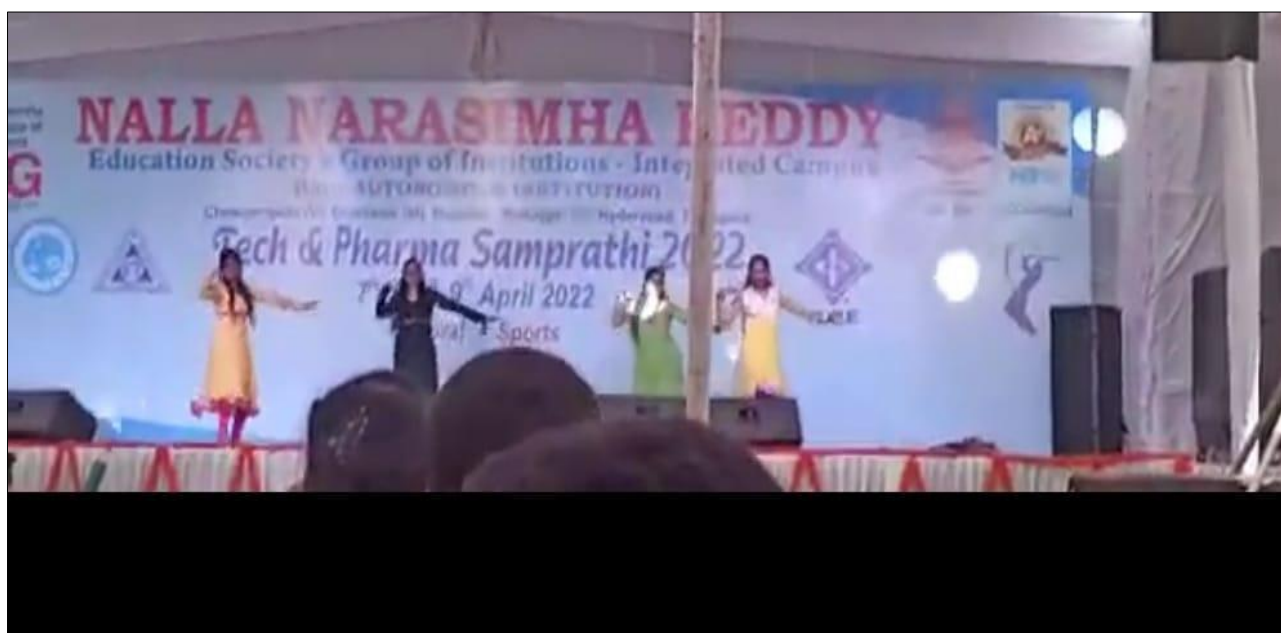
Group Dance Performance by B.Pharmacy Students