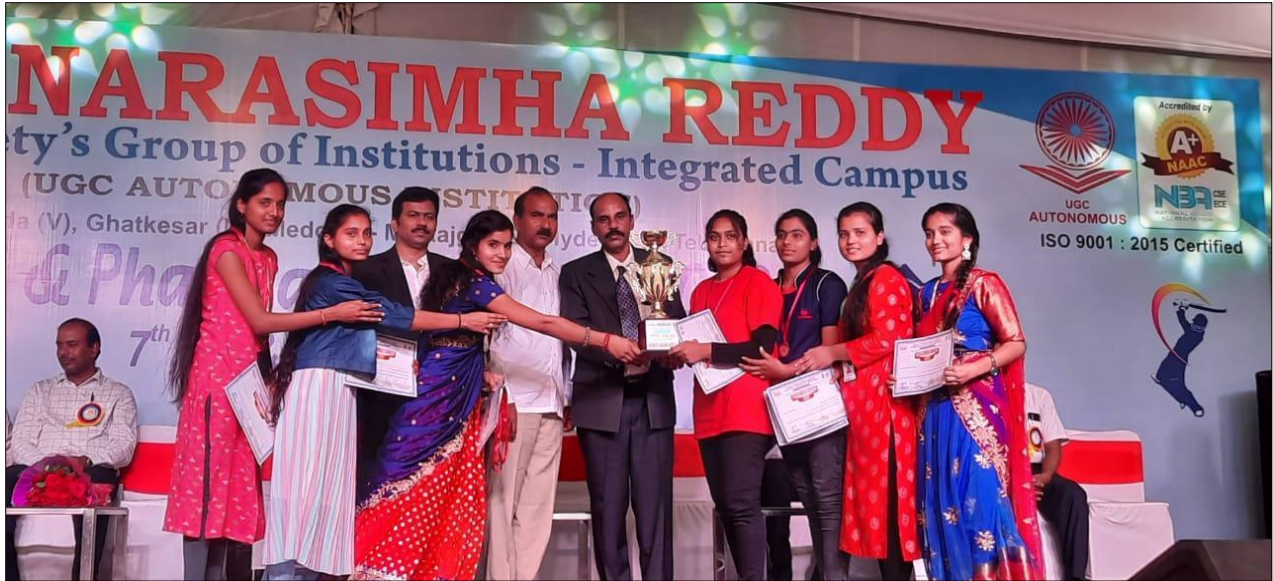
Women's Kabaddi winners B.Pharmacy I year