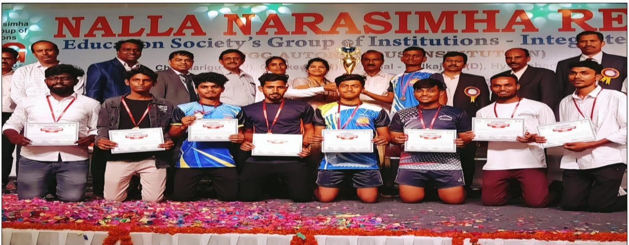
Men's Kabaddi winners B.Pharmacy I year