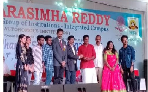
Winners of various events receiving prizes at the valedictory