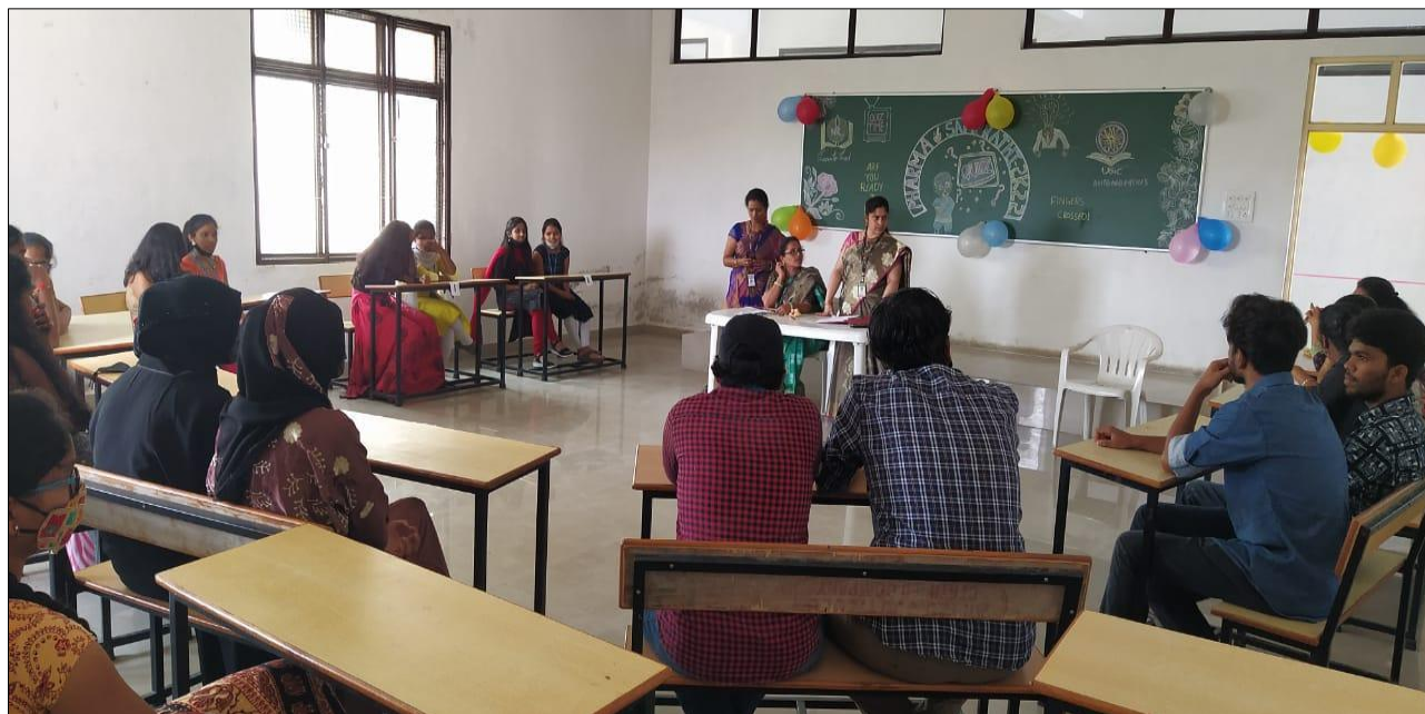
Active Participation of Students in Quiz Competition

On Day 2 along with technical events Cultural Events were also conducted where 52 students from B.Pharmacy took part and presented their singing and dancing talents.