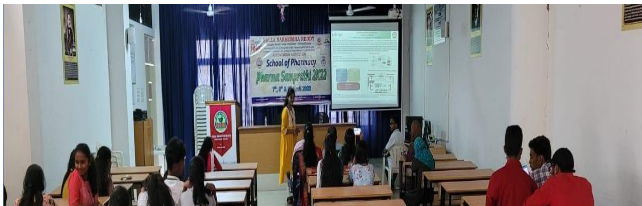
Student Presenting e-Poster