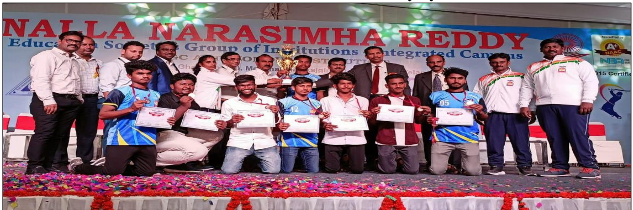
Men's Volley ball Winners B.Pharmacy I year