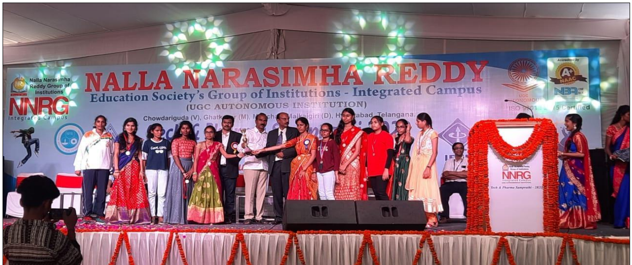
Women's Kho Kho winners B. Pharmacy I year