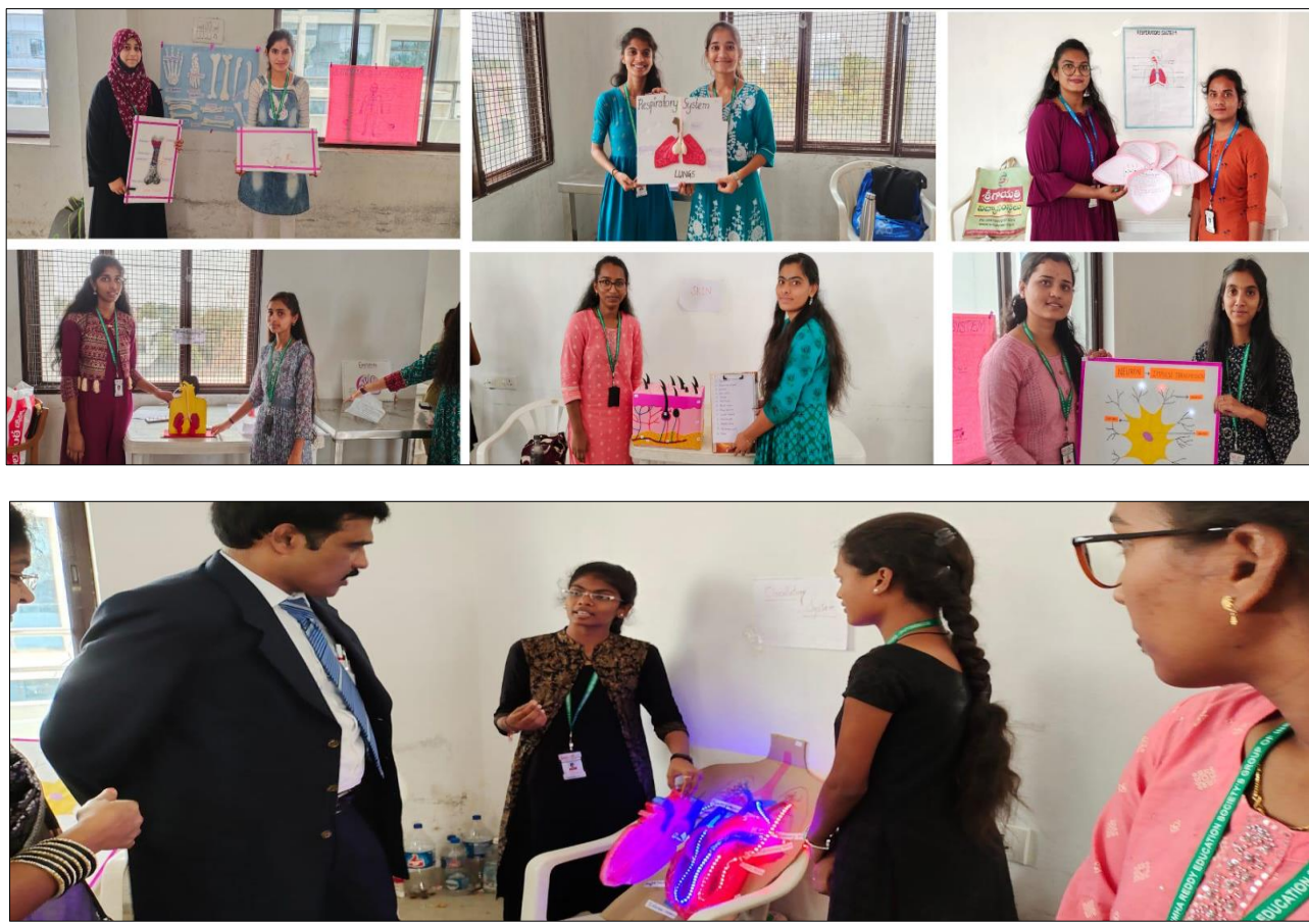
Students presenting Live Models

Model presentation broadcast structural and physical mode of presentations which enlightens the technical and creative skills of the students. 26 live models were prepared and presented by the students, where their technical knowledge and creative skills were analyzed and assessed.